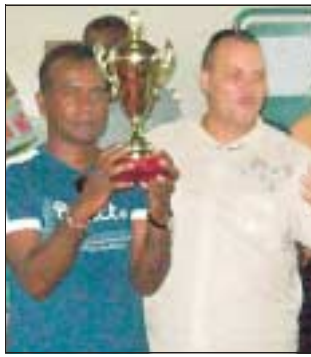
Le trophée des champions a été gagné par le Papangue contre le CDC Sainte-Marie.

bien faire en championnat et espèrent réussir un beau parcours en coupe.